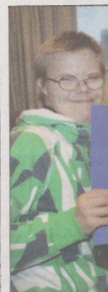
Lännen Oma... yhtiöt Vakka... tivat kukin jo... 5000...