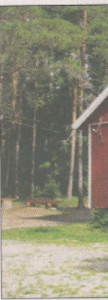
Suden maja s... massa. Majal...